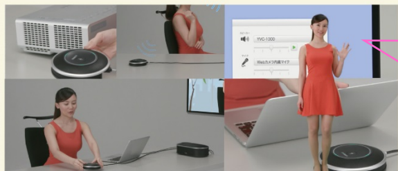
快適な遠隔コミュニケーションをするための5つのコツ

基本的な使い方・マイクの拡張・Bluetooth・ 音声ガイダンスなど設定方法を紹介