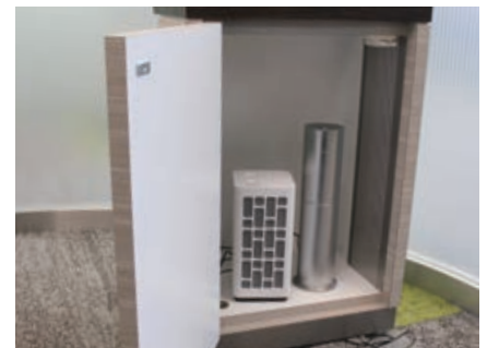
台の中にアロマディフューザーとともにVSP-1を設置