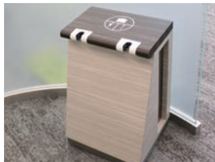
傘や杖を立てておくことができる荷物置台