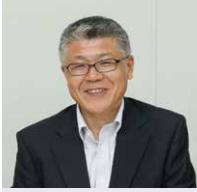
三和コンピュータ株式会社 サービス・パブリックソリューション 事業部長 兼 SIソリューション 部長 兼 北海道支店長