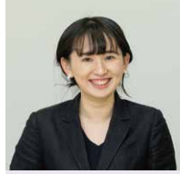
三和コンピュータ株式会社 ソリューション事業本部 SIソリューション部