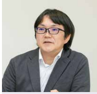
三和コンピュータ株式会社 ソリューション事業本部 SIソリューション部 主任